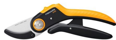
Sekator kowadełkowy Plus (P741) ok. 89 zł