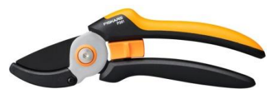
Sekator kowadełkowy Solid™ (P361) ok. 54 zł