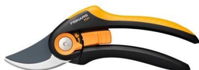
Sekator nożycowy Plus™ (P541) ok. 82 zł