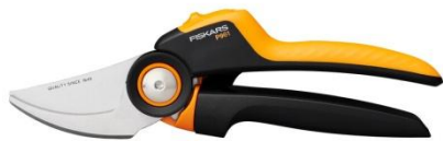
Sekator nożycowy X-series™, L (P961) ok. 125 zł