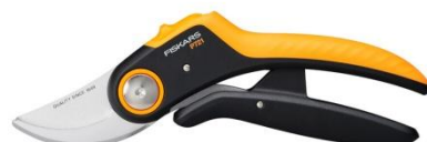
Sekator nożycowy Plus (P721) ok. 89 zł